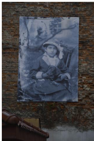
Elhurcolt zsidó családok